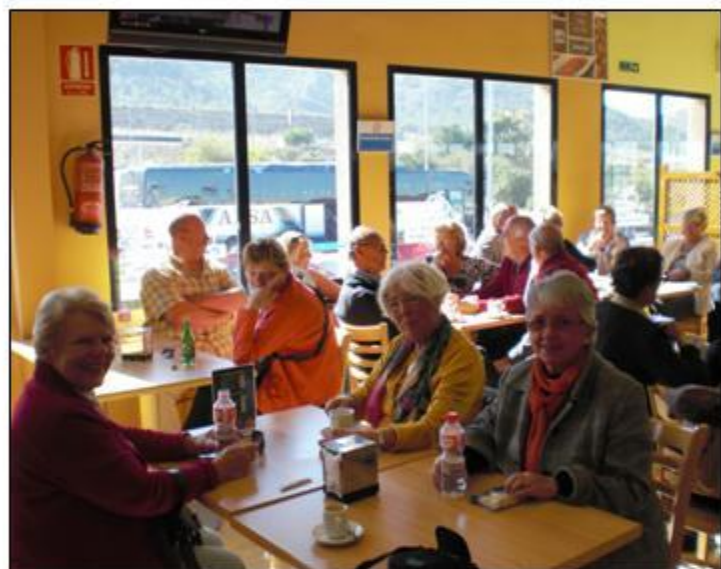
FOTO IMPRESSIE VAN DE 2 DAAGSE BUSUITSTAP NAAR CARTAGENA OP 2 EN 3 MAART 2011