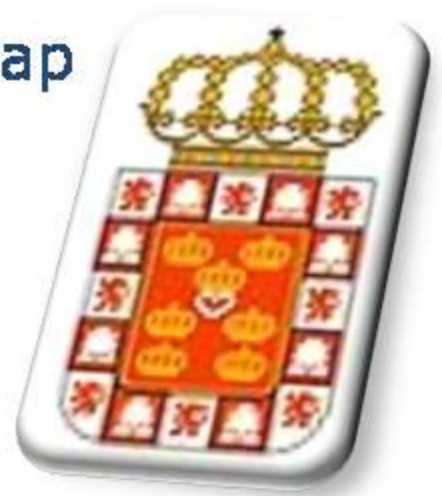
Foto impressie busuitstap Murcia 29 juni 2012