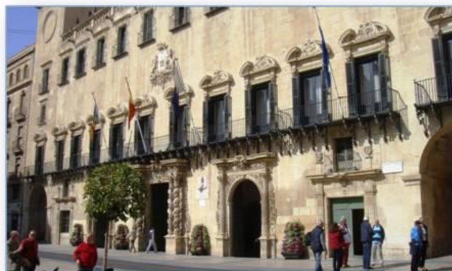
Bezoek aan het prachtige stadhuis