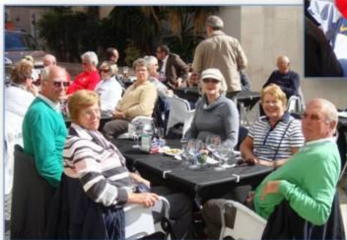
Met 41 wandelaars een plaatsje zoeken voor de lunch