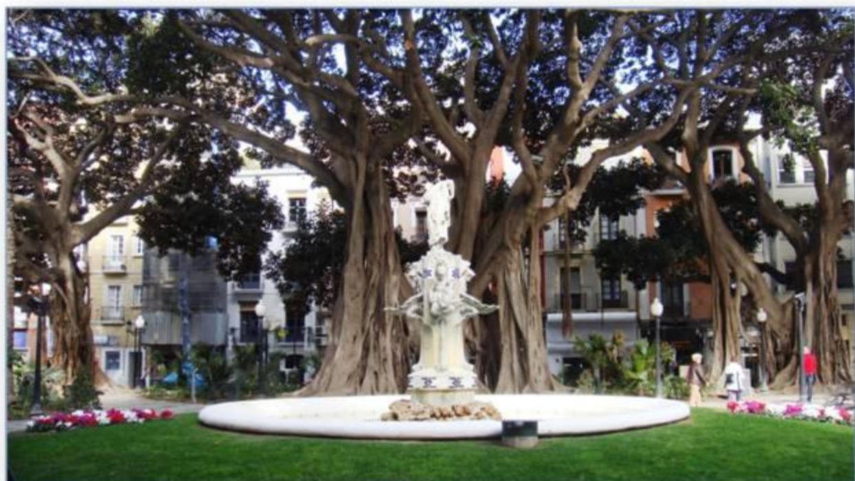
De imposante bomen rond de Plaza de Gabriel Miró