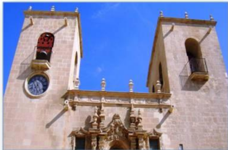
Iglesia de Santa Maria