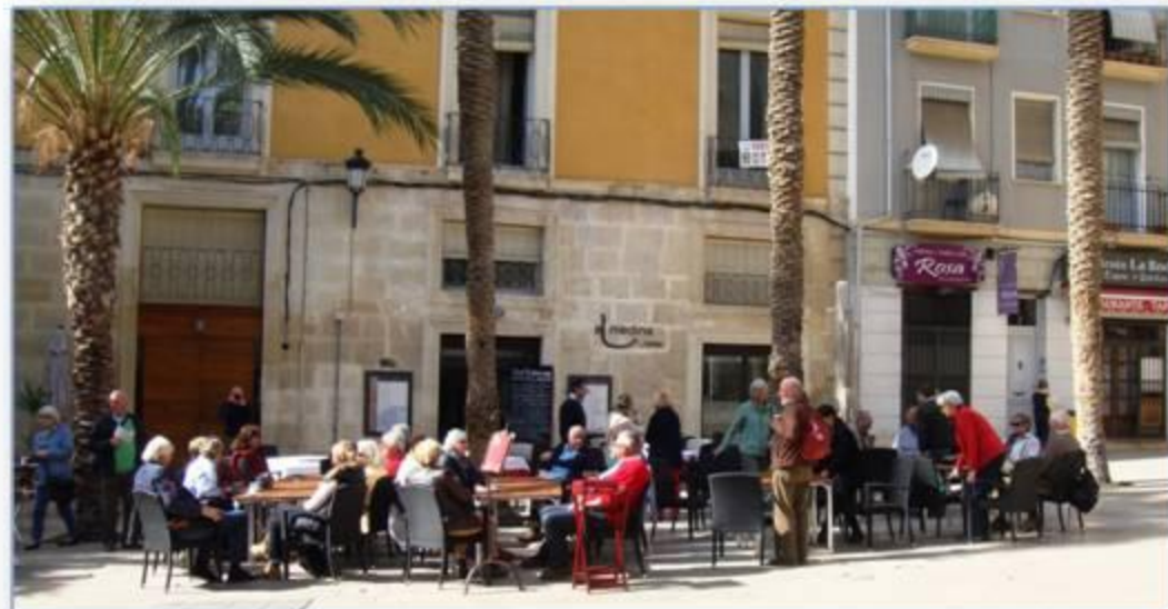
Tijd voor de koffie