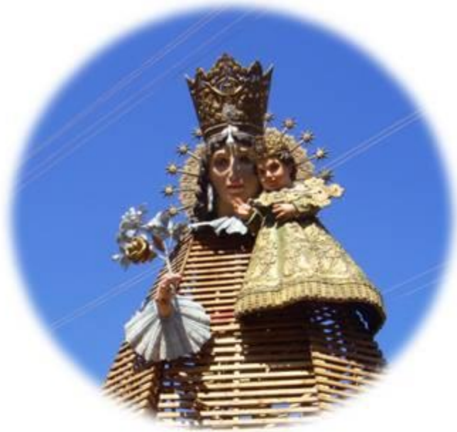
La Virgen de los Desamparados...