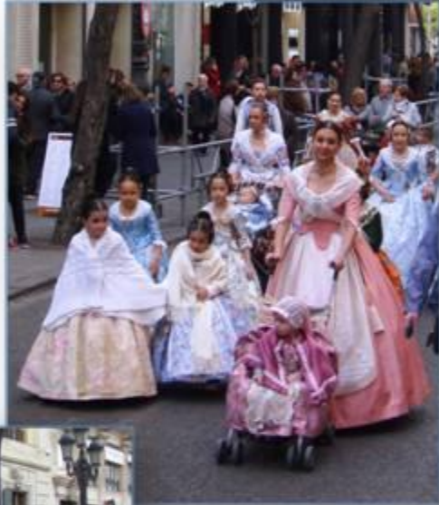
Jong en oud in traditionele klederdracht...