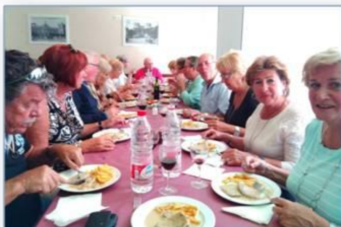
Hierna was het tijd voor de lunch .....