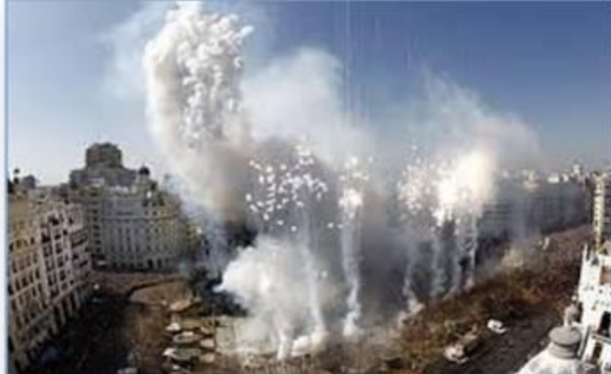
De "Masclatá", het knalvuurwerk